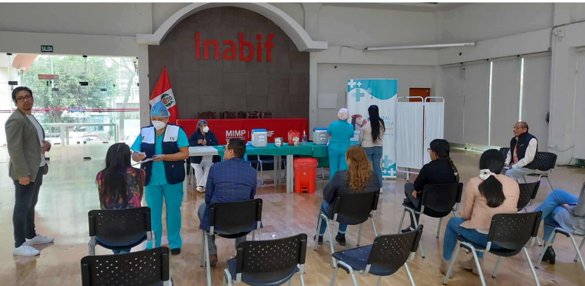
"Dónde contamos con la participación de la alcaldesa de la Municipalidad de Pueblo Libre, Mónica Tello. "

Porque estamos comprometidos con la salud de nuestra comunidad, llevamos a cabo la “Campaña de Vacunación” contra la influenza y neumococo dirigido al personal de la Municipalidad de Pueblo Libre e INABIF . La misma que contó con la participación de la alcaldesa de Pueblo Libre, Mónica Tello ”.